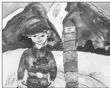
Рис. Осиповой Аэлиты, 1 А класс