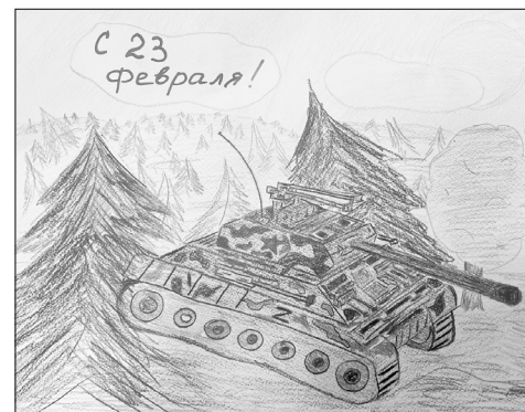
Рис. Сидоренко Веры, 3 Г класс