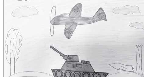
Рис. Межлумян Элины, 2 Б класс