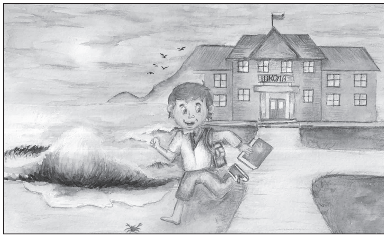
Рис. Ханизбековой Софии, 1 А класс