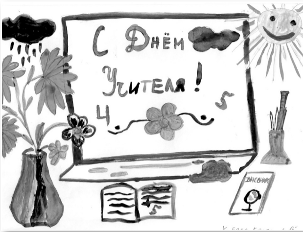
Кобзев Константин, 2 В класс