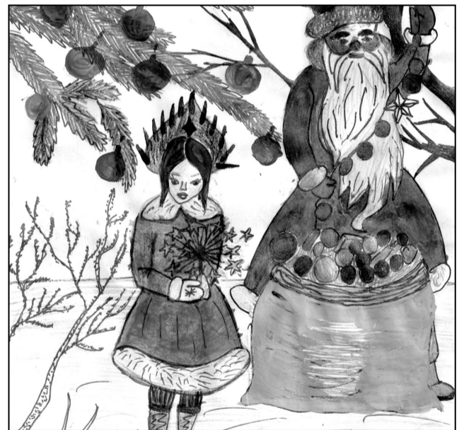
Тимонина Дарья, 3Г