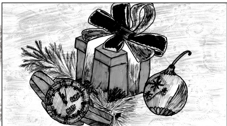
Григорян Элина, 3В