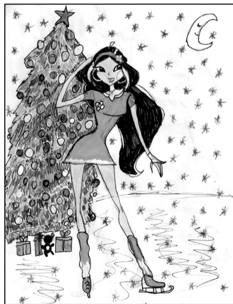
Григорян Юлия, 3В