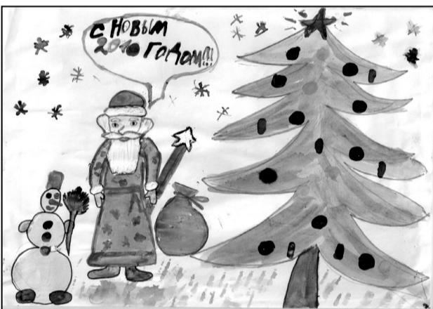
Тонян Георгий, 2А