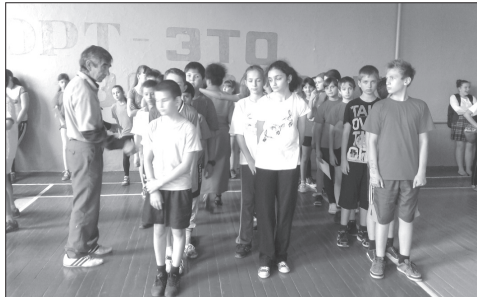
Соревнования «Малые олимпийские игры»