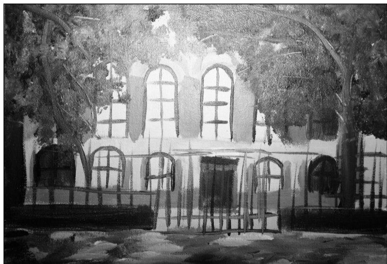
Рис. Садовой Арины, 5 В класс